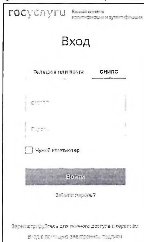
Рис. 3 Форма входа в ЕСИА при помощи СНИЛС

Для авторизации при помощи СНИЛС перейдите на вкладку «СНИЛС». В соответствующие поля введите ваши СНИЛС и пароль и нажмите на кнопку «Войти».