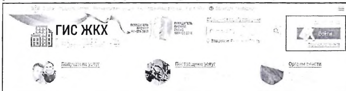
Рис. 1 Главная страница официального сайта ГИС ЖКХ. Кнопка «Войти» Отображается страница для входа в ЕСИА.

Для входа в личный кабинет требуется авторизация в ЕСИА 1 . Откройте главную страницу официального сайта ГИС ЖКХ ( http://dom.gosuslugi.ru/ ) и нажмите на кнопку «Войти».