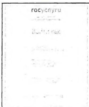
Рис. 5 Форма выбора роли пользователя в ЕСИА

После авторизации в ЕСИА одним из перечисленных выше способов отображается форма выбора роли пользователя.