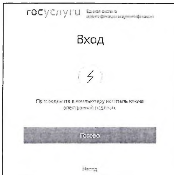
Рис. 4 Форма входа в ЕСИА при помощи электронных средств

После авторизации в ЕСИА одним из перечисленных выше способов отображается форма выбора роли пользователя.